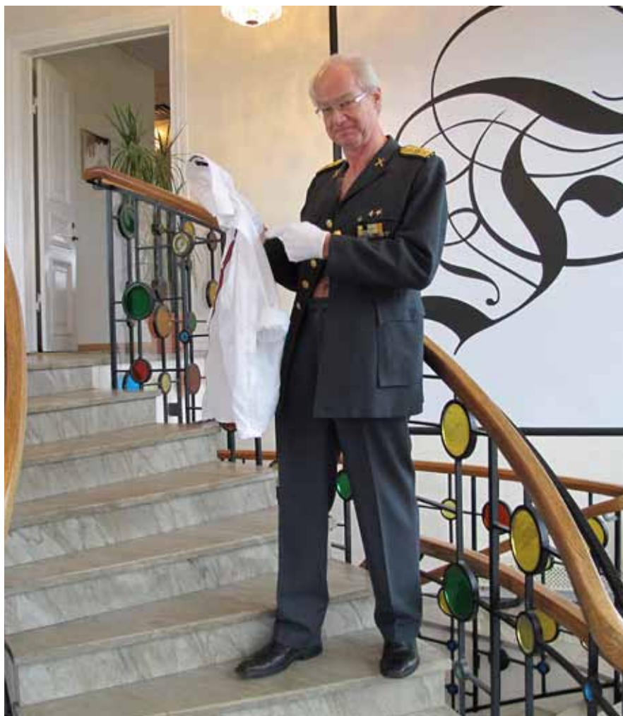
"Kungen" i trappan på Hotel Falkberget Apartments. www.falkberget.se