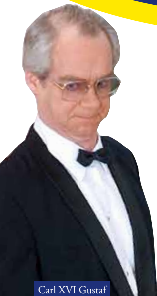
Carl XVI Gustaf