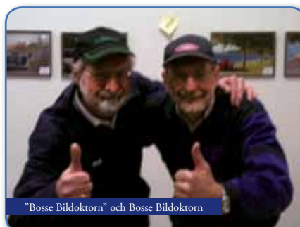
"Bosse Bildoktorn" och Bosse Bildoktorn